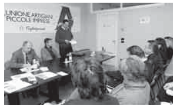
Gli artigiani partecipanti all'incontro sul tema della competition

La ricetta dei giovani imprenditori artigiani, condivisa dal professor Gregori, è stato il frutto di un dibattito prolungato che ha coinvolto giovani anche esterni all'area del Manganesese, come il fondatore del gruppo giovani (ormai senior) imprenditori che ope-