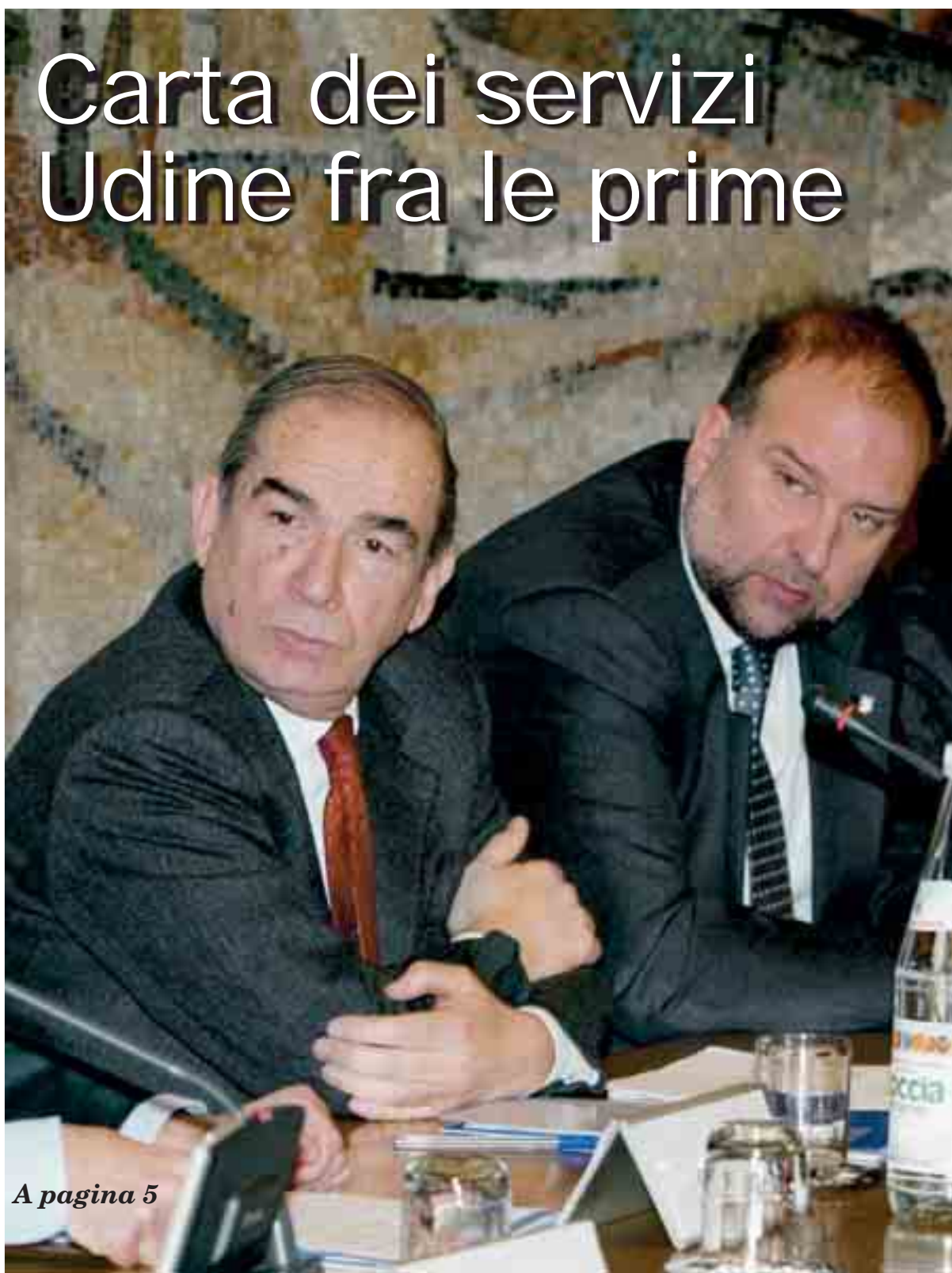
A pagina 5